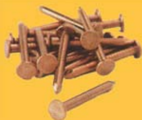
TORNILLOS Y CLAVOS