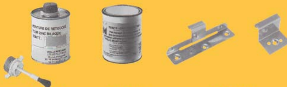
PINTURA PARA RETOQUES